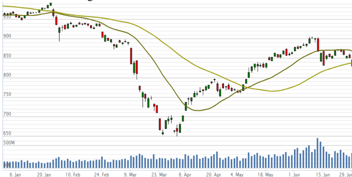
Vn-Index - 6 tháng