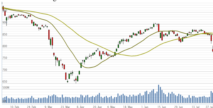
Vn-Index - 6 tháng