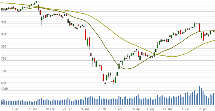
Vn-Index - 6 tháng