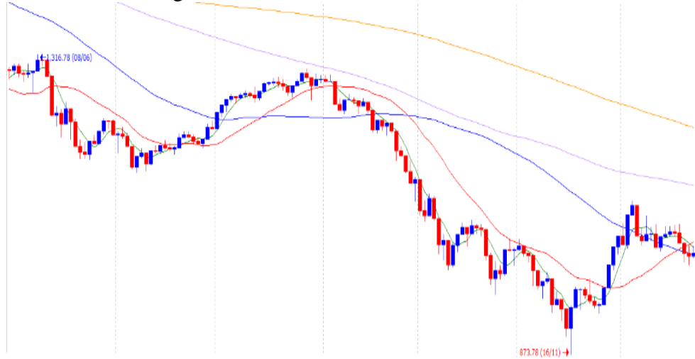
Vn-Index - 6 tháng