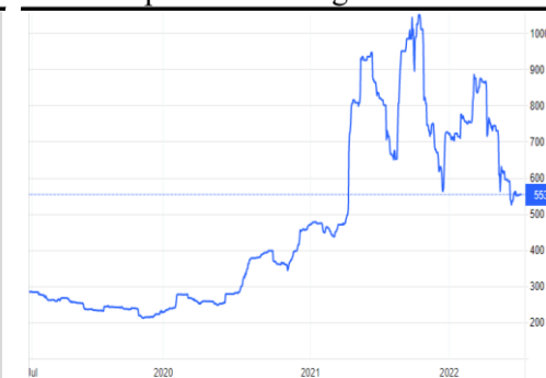
Giá phân Urea thế giới từ 1919