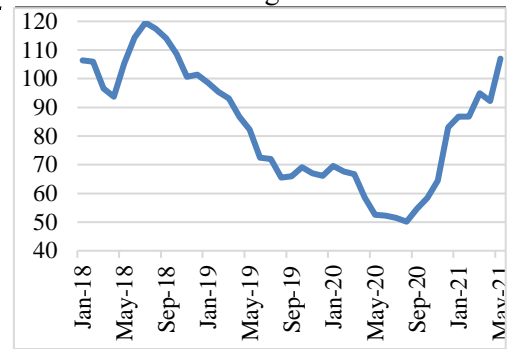
Giá than thế giới từ 2018