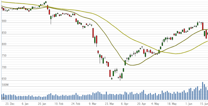
Vn-Index - 6 tháng