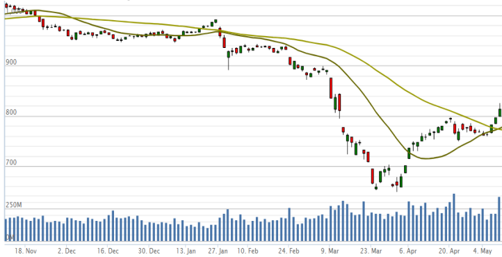
Vn-Index - 6 tháng