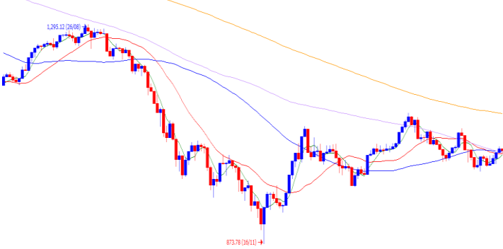
Vn-Index - 6 tháng