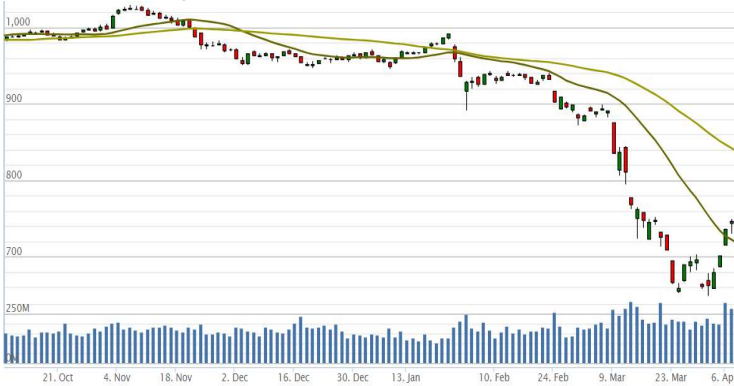
Vn-Index - 6 tháng