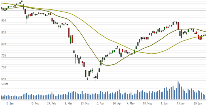
Vn-Index - 6 tháng