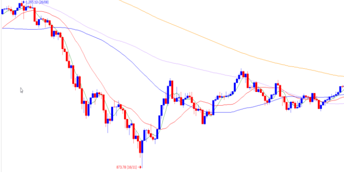
Vn-Index - 6 tháng