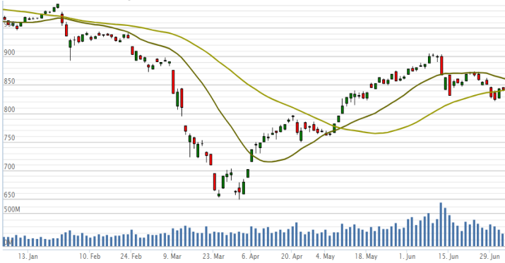
Vn-Index - 6 tháng